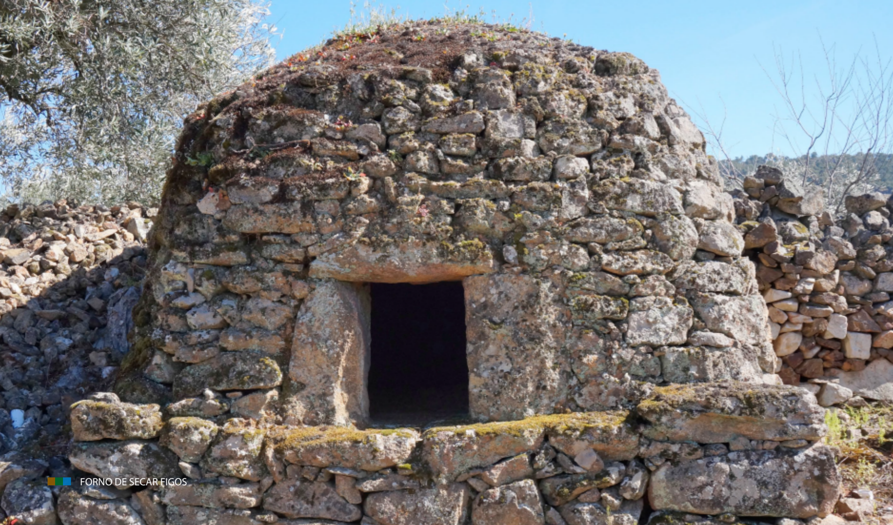
FORNO DE SECAR FIGOS

A antiga “Póvoa d’Álem Sabor” atesta as origens remotas do povoado medieval, anterior à fundação da Nacionalidade e assim designada pela centralidade castelhana, passando a chamar-se Vila Flor no reinado de D. Dinis, que se quedou de espanto perante a exuberância, a beleza do local e o florido que a envolvia. Assim se rebatizou a Vila e afirmou o seu estatuto de praça amuralhada, com 5 portas, das quais apenas resta uma, que, por coincidência, se designa Arco de D. Dinis.