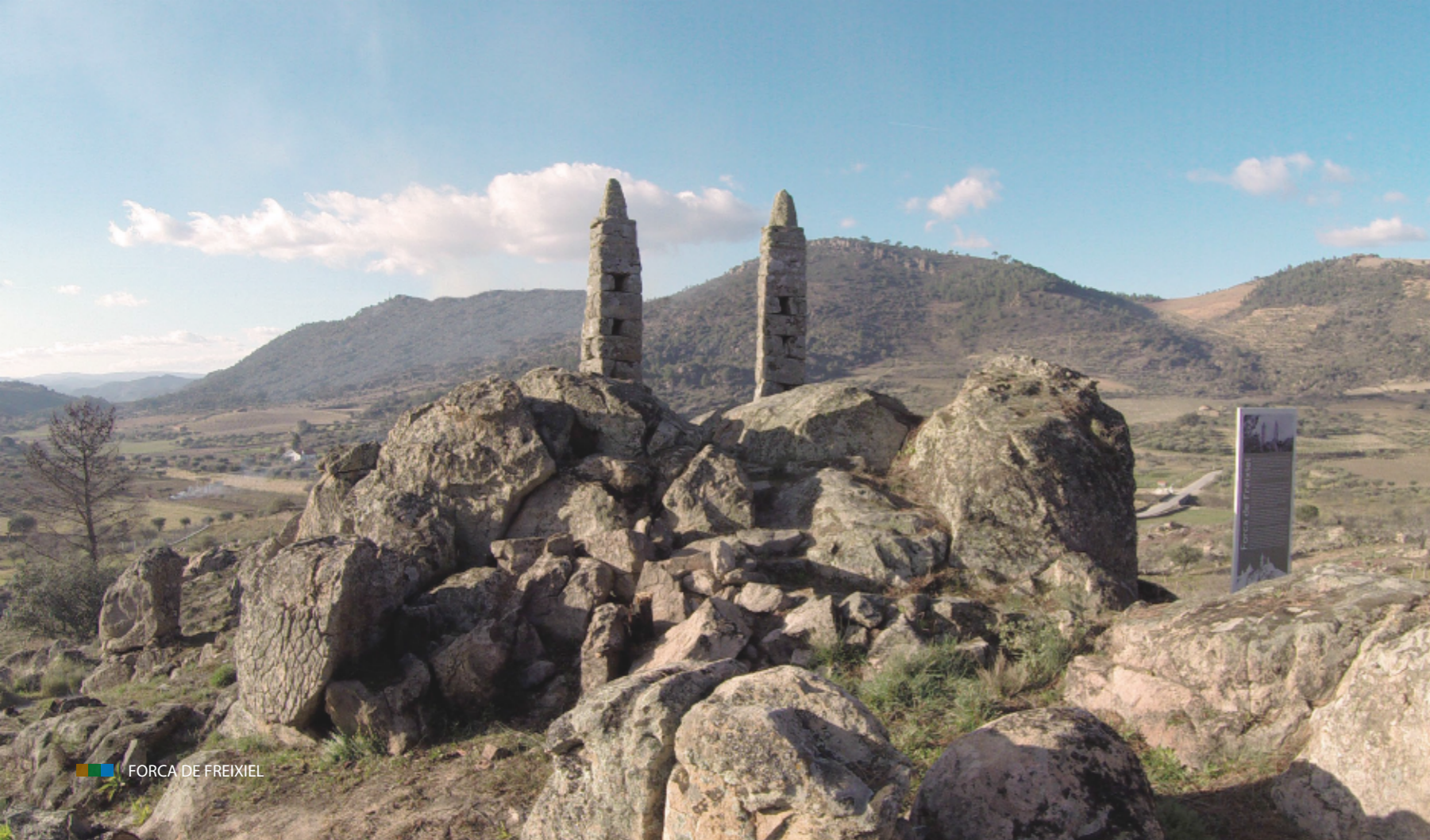
FORÇA DE FREIXIEL